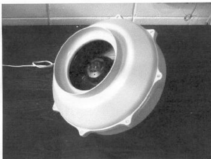
Figura 1 – Ventilador ensaiado

Marca : Multivac Modelo : RK 200 L Tipo : tubo-centrífugo Material da carcaça : PVC Área da seção de entrada : 0,0177 m 2 Área da seção de saída : 0,0295 m 2 Rotação nominal : vide item 5 Acionamento : direto Motor elétrico não calibrado : marca EBM, modelo R2E-250-AQ05-05, 2 550 rpm, potência 130 W, 230V monofásico, 60 Hz.